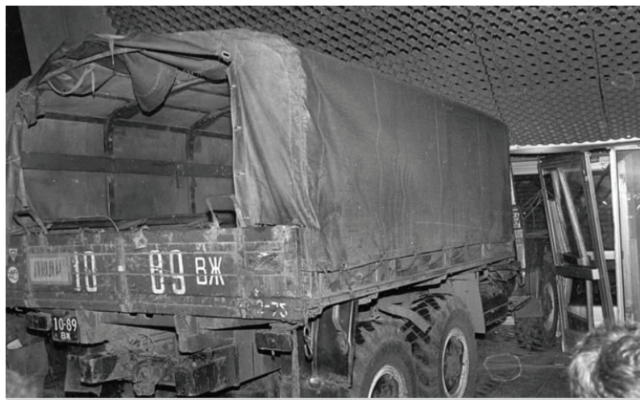
Штурм телецентра Останкино

3 Октября началось, что называется время «Ч». В 14:00 состоялся разрешенный Моссоветом митинг в поддержку Верховного Совета на Октябрьской площади. Когда собралось несколько тысяч человек, поступила информация, что в последний