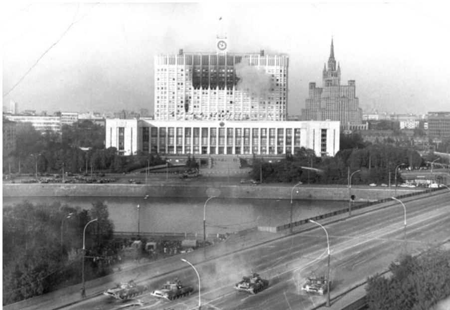
Расстрел Белого дома

События того года, заслуживают отдельного рассмотрения, которое и придет в нашей газете со временем.