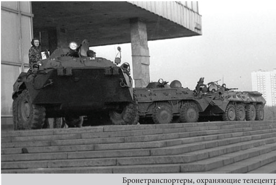
Бронетранспортеры, охраняющие телецентр

Как только Макашов с частью охраны оказался у двери, напротив которой на балконе засело подразделение Лысюка, несколько бронетранспортеров открыло огонь по зданию телецентра. Самое жуткое, что в общении с прокуратурой защитники демократии были более откровенны,