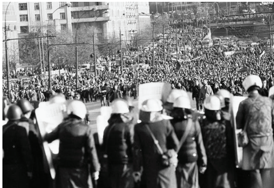
3 октября, Садовое кольцо. Массовое шествие сторонников парламента

Президенту «процедура окуривания» после возможной процедуры импичмента показалась вдвойне привлекательной: способ гарантировал стопроцентную надёжность, ведь противогазов у парламентариев не было.